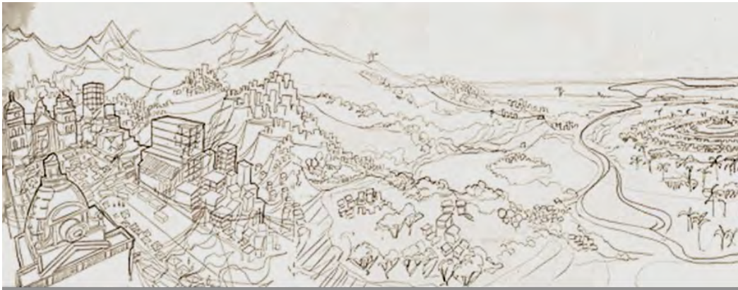
Ilustración: Román Nina